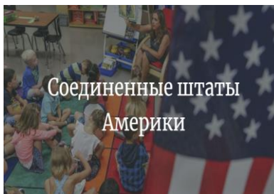
Соединенные Штаты Америки

августе, в других - через 1-2 дня после Labor day - праздника труда, который отмечается в первый понедельник сентября. В первый день в школе уроки не проводятся. Первоклашки и их родители приходят в школу знакомиться с учителем и классом. Все очень обыденно, без цветов и бантов.